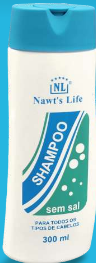
PARA TODOS OS TIPOS DE CABELOS

Cabelos bonitos, com brilho, sedosos e com balanço é o que todos desejam. Por isso a Nawt's Life desenvolveu o melhor, e lhe oferece este Kit. Indicado para cabelos ressecados ou danificados, devolve o brilho e a maciez, deixando-os sedosos e fáceis de pentear.